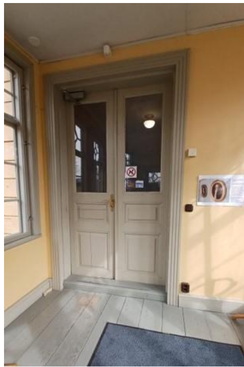
Ulko-ovea ja sen yläpuolista ikkunaa pudotettiin niin, että sisäänkäynti saatiin esteettömäksi. Kuistin lämmöneristystä parannettiin ja teetettiin uudet väliovet.