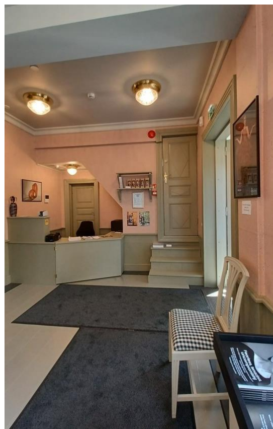
Taidemuseon uudistetut yleisötilat, kuistin porrastin, museokauppa ja lipunmyynti.