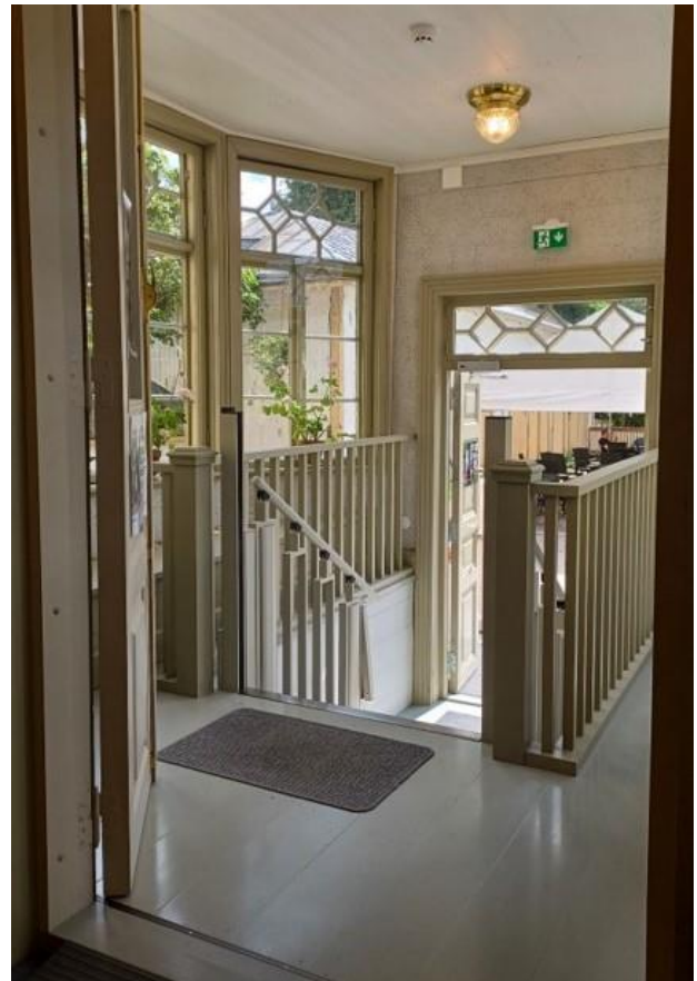
Restauroitu kuisti ja oven edusta. Oikealla kuvassa porrastin paikalleen asennettuna.