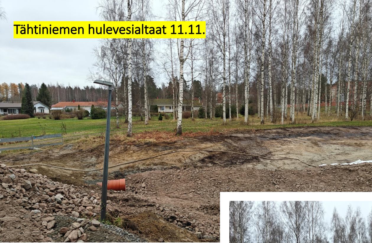
Tähtiniemen hulevesialtaat 11.11.