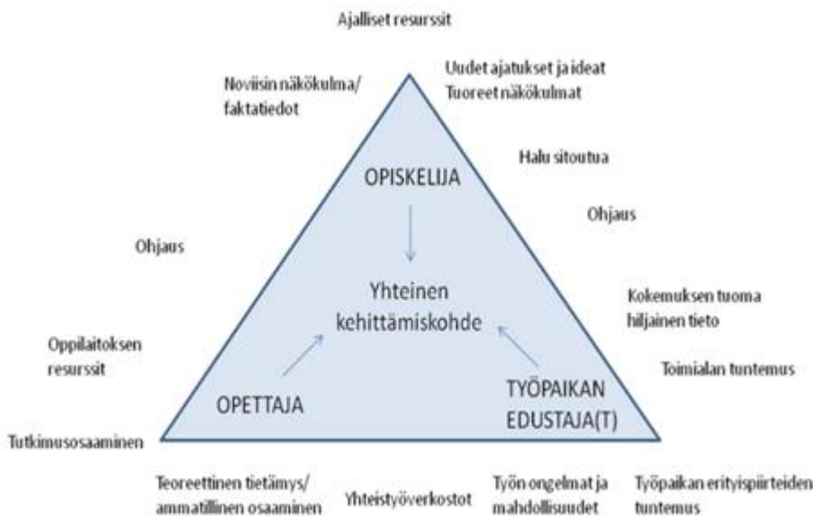
Kuvio 4. Oppilaitoksen, opiskelijan ja työpaikan välinen kehittävä siirtovaikutus (Ahola, Kivelä & Nieminen 2005, 110–111.)