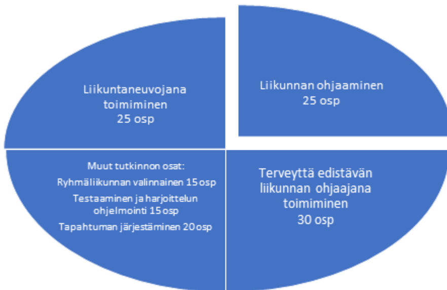
Kuva 1. Case: Heinolan Kaupungin liikuntapalvelut / ikääntyneet -työelämäyhteistyöhön liittyvät tutkinnon osien kokonaisuudet / Liikunnanohjauksen perustutkinnon ePerusteet

Kumppanuusmallissa liikuntapalveluita tuottavat ja ohjaavat liikuntaneuvojaopiskelijat – Suomen Urheiluopiston asiantuntijoiden ja opettajien ohjauksessa. Työpaikkaohjaajana Heinolan kaupungin kumppanuussopimuksessa toimii Suomen Urheiluopiston edustaja, joka myös omalta osaltaan vastaa yhteistyön ja opiskelijoiden toiminnan laatu- ja turvallisuustekijöistä.