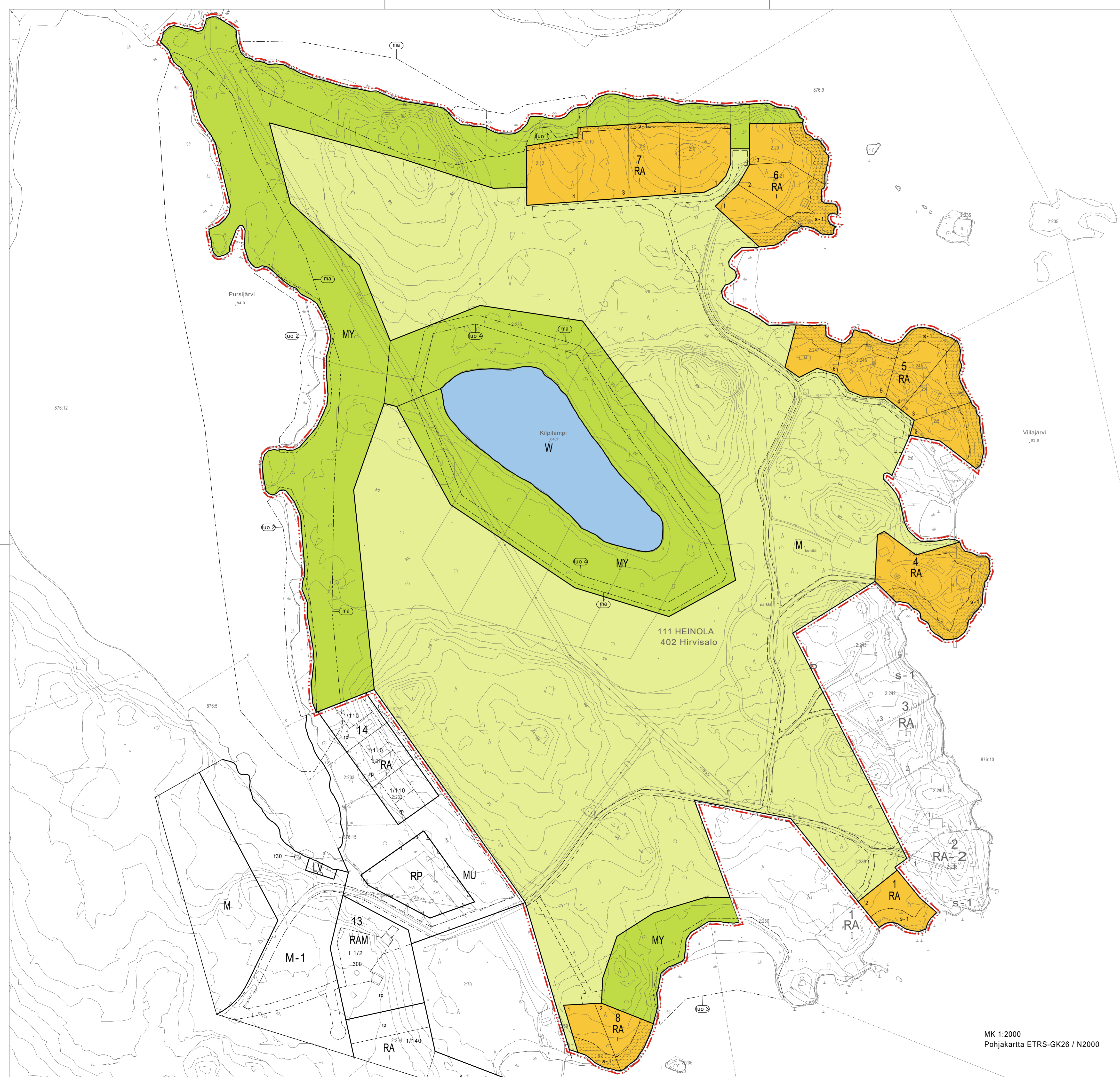
MK 1:2000 Pohjakartta ETRS-GK26 / N2000