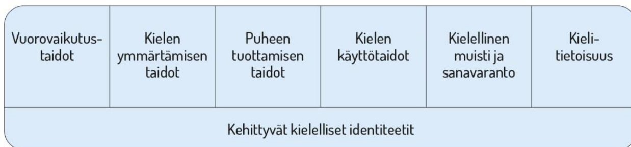
Kuvio 2. Lasten kielen kehityksen keskeiset osa-alueet varhaiskasvatuksessa

Kielen oppimisen kannalta on tärkeää tiedostaa, että saman ikäiset lapset voivat olla eri vaiheissa kielen kehityksen eri osa-alueilla. Kielelliset identiteetit kehittyvät , kun lapsia ohjataan ja tuetaan kielellisten taitojen ja valmiuksien keskeisillä osa-alueilla.