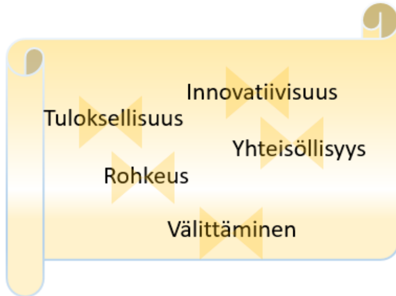
Kuvio 2. Heinolan strategian arvopohja

Heinolan kaupungin arvoiksi on valittu innovatiivisuus, rohkeus, tuloksellisuus, välittäminen ja yhteisöllisyys . Kuviossa 2 esitetyt varhaiskasvatukselle tärkeät arvot on avattu niillä asioilla, jotka on nousseet Heinolan esiopetussuunnitelmasta ja lapsille, huoltajille ja henkilöstölle suunnatusta kyselystä. Kyselyn tuloksena vahvasti esiintynyt osallisuus lisättiin esiopetuksen ja varhaiskasvatuksen arvoihin.