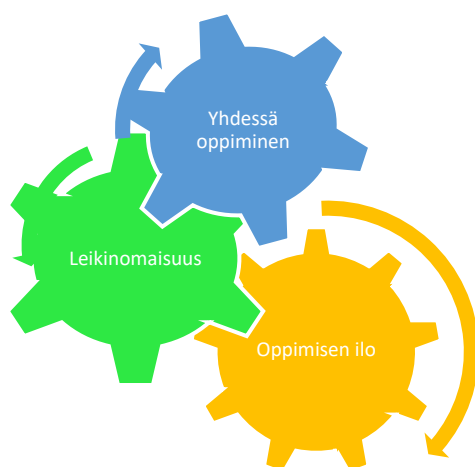
Kuvio 3. Oppimiskäsitys Heinolassa

Heinolassa oppimiskäsityksen paikallisiksi teemoiksi nousivat yhdessä oppiminen, leikinomaisuus ja oppimisen ilo (Kuvio 3).