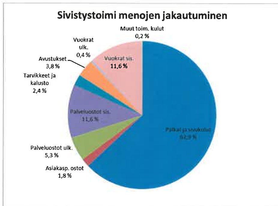
Kaavio 2: Sivistystoimen menojen jakaantuminen menokohdittain TAE2017

Mittavat kiinteistöjen kuntotutkimukset sekä investointitarpeet jatkuvat edelleen päiväkotijä koulurakentamisessa ja niillä on merkittävä vaikutus sisäisiin vuokratuluihin.